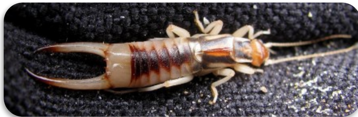
Рис.14. Уховертка прибрежная