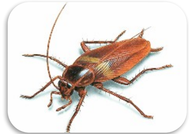
Рис. 4. Рыжий таракан