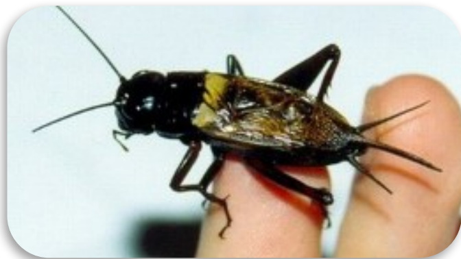
Рис. 11. Сверчок двупятнистый