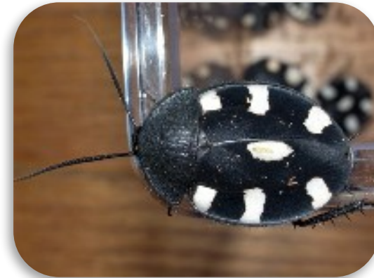
Рис. 6. Шахматный таракан или таракан-домино