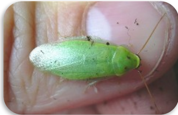
Рис. 5. Зелёный банановый таракан