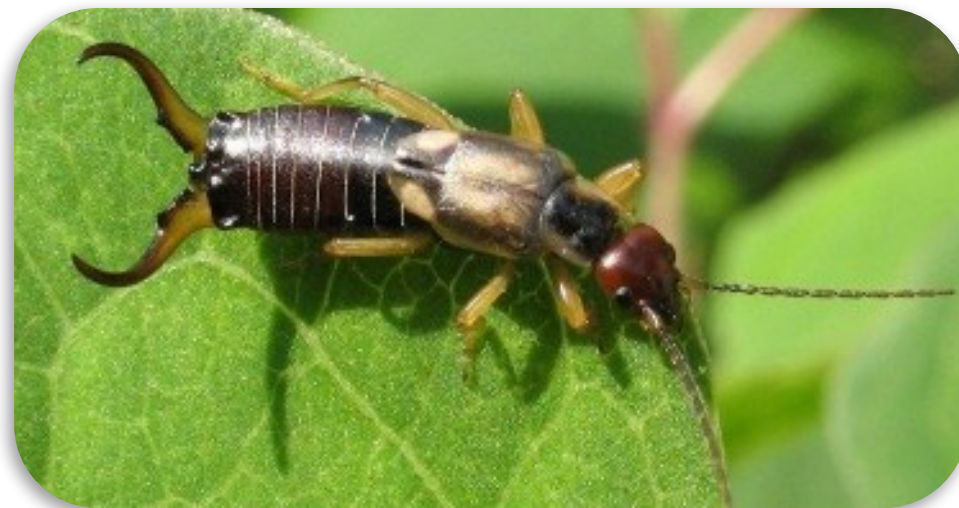
Рис. 13. Уховертка обыкновенная