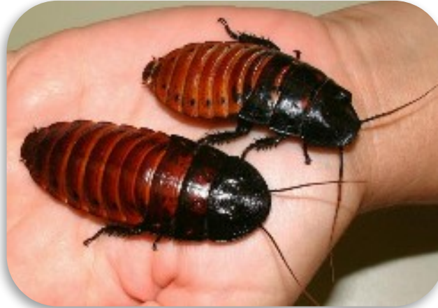
Рис. 3. Мадагаскарский шипящий таракан