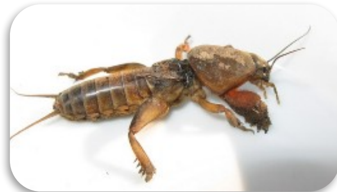
Рис. 12. Медведка обыкновенная