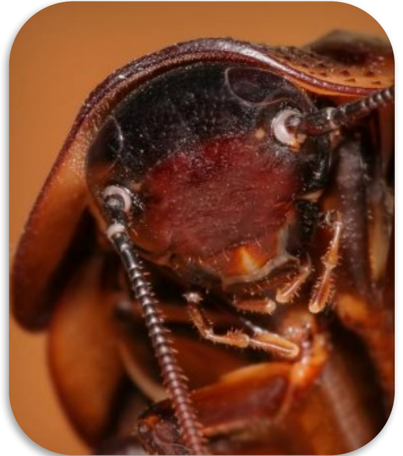
Рис.1. Таракан рыжий