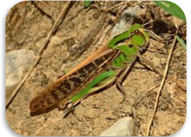
Рис. 10. Саранча перелётная