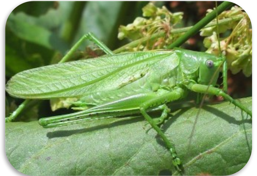
Рис. 7. Кузнечик зеленый