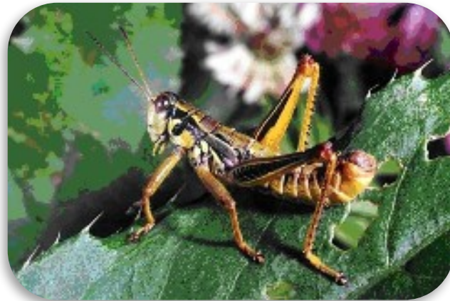
Рис. 9. Кобылка бескрылая