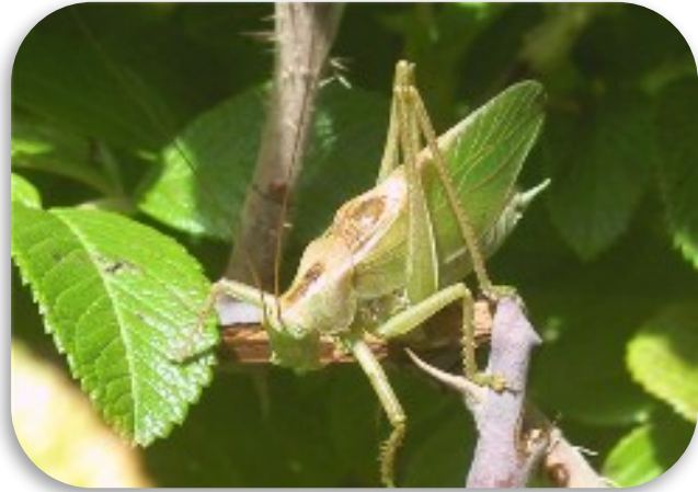
Рис.8. Кузнечик певчий