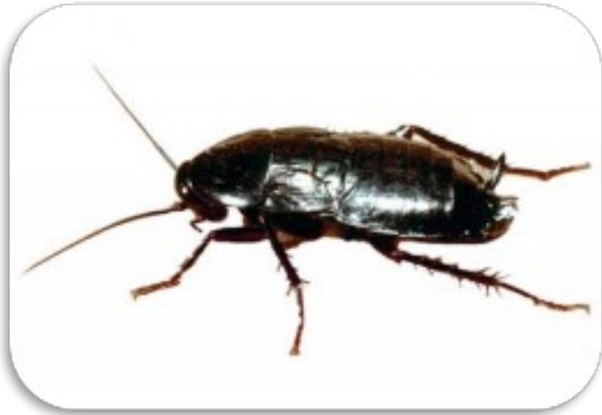
Рис. 2. Чёрный таракан