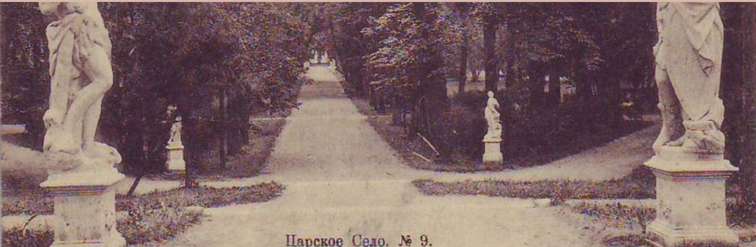
Царское Село. № 9.

Преподаватели всячески поощряли творческое свободомыслие, совместное отыскание истины в спорах и диспутах. Наставники не допускали у своих учеников пустословия. Каждый педагог стремился добиться ощутимых практических результатов от учеников.